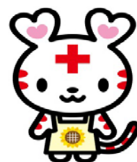
赤十字健康大学受講者数