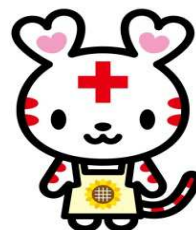
赤十字健康大学受講者数