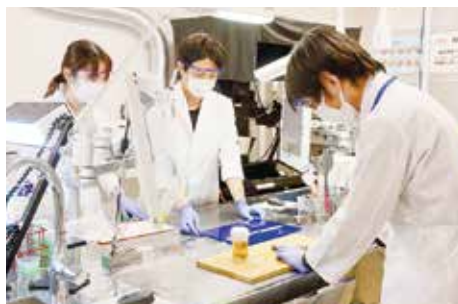
手術検体の処理(切出し)作業の様子

今後も“オーダーメイドの医療”を支え、臨床の要望に柔軟に対応できる体制作りを継続していきます。