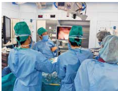
腹腔鏡手術の様子

われわれの治療介入にて、消化器疾患を克服し、笑顔を取り戻せる方が一人でも増えるよう努力してまいります。