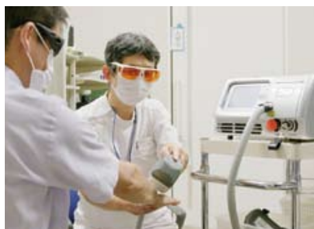
紫外線療法による治療風景

上記のように皮膚科では、院内の医療安全に積極的にかかわり、患者さんが安心、安全な医療を受けられるよう、また各科主治医が計画した治療を最後まで継続できるようサポートしていきたいと考えています。