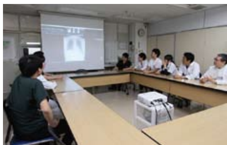
週2回行われる呼吸器内科カンファレンス

「患者さんに強く伝えたいのはタバコは絶対にやめたほうがいいということ。レントゲンは年に一度は受けたほうが良いでしょう。症状が出ていないうちに見つかれば治る病気も多いからです。タバコを止めるというのは本当に辛いこと。私たちにはお手伝いしかできませんが、ぜひ禁煙外来をお試しく下さい」