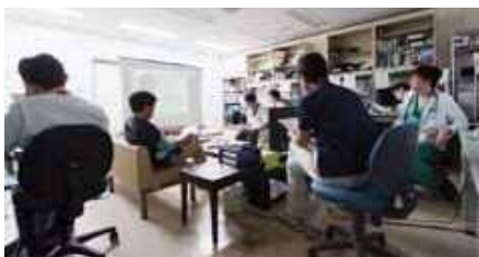
毎朝8時から医局で行っているカテーテルカンファレンス

「現在新病院が建設中ですが、新病棟が完成すれば、救急外来、循環器センター外来、カテーテル検査室、CCU、手術室、循環器センター入院病棟の位置関係が近くなり、スタッフにとっても患者さんにとっても理想の形になるでしょう」