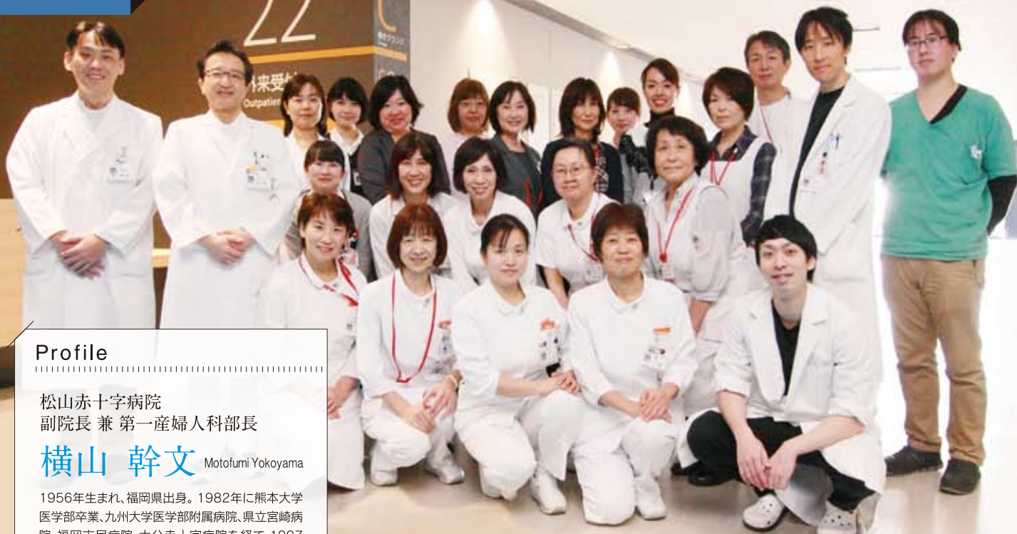
産婦人科 / 【医師】9名 【看護師】7名 【事務】4名 【DA】2名