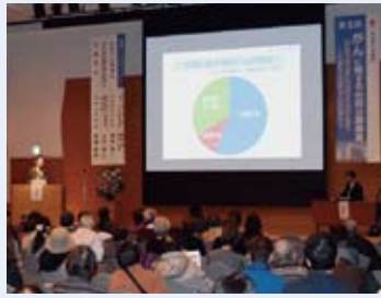
[昨年の様子] 会場:いよつ高島屋

平成30年3月10日(土)に『がんに関する市民公開講座』を開催いたします。今回は「もっと知ろう! 正しく知ろう! 女性のがん～乳がん/子宮・卵巣がん～」をテーマに、がんに関する基礎知識や治療について当院の医師による講演を予定しております。また、当日ご参加いただいた方(300名限定)には素敵な記念品をご用意しております! お気軽にお越しください。