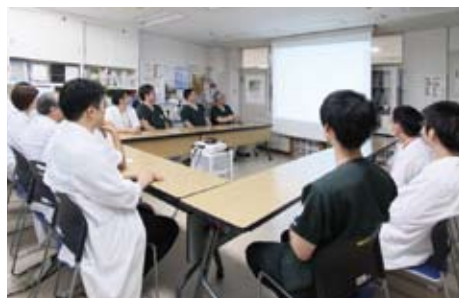
呼吸器外科・呼吸器内科・放射線科・病理診断科が月1回行っている合同カンファレンス(CRPC)

「肺がんは患者さんと医師だけで立ち向かえる病気ではありません。ご家族や周囲の方々の協力をいただきながら、最善の医療を提供していきます」