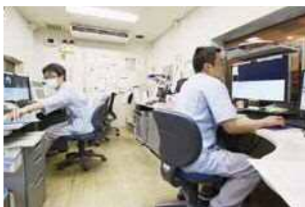
MRI操作室担当の医師により適切な画像検査が行われる