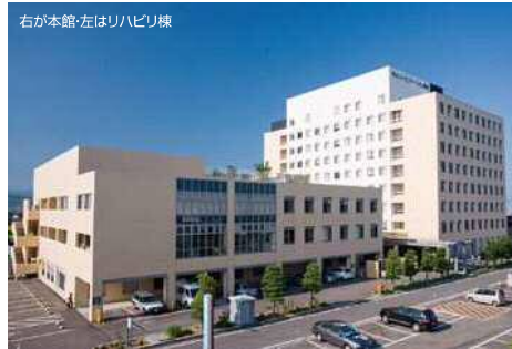
右が本館・左はリハビリ棟

「リハビリテーションを軸とした社会貢献」を法人理念とし、回復期、維持期における生活を見据えながら、多職種がチーム一丸となり患者様の在宅社会復帰を支援しています。また、平成20年からは愛媛県の指定を受け、高次脳機能障害支援拠点機関としての普及活動等にも努めています。