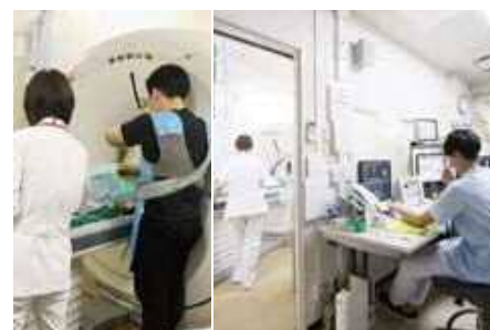
CT下膿瘍穿刺の治療風景(左)。局所麻酔を行った後にCTの画像誘導下に病変部に針を進め、チューブを膿瘍内に挿入して体外に膿を排泄する。

機器の精度は格段に進歩しています。画像が鮮明になり、診断がしやすくなったのはもちろん、安全性も高くなりました。さらにその機器を使う専門医の能力が高いほど、的確な診断ができるのです。放射線科には7名が在籍、うち6名が専