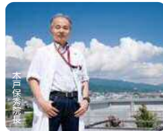
医療法人財団慈強会 松山リハビリテーション病院