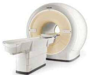
当院導入予定の最新機器(MRI) [Philips Ingenic 3T]

一体となり質の高い医療を提供していくことが可能なのです。定期的カンファレンスを行い、開業医の方から依頼を受けてCTの診断をすることもあります。放射線科医として神経放射線領域の臨床研究、学生や研修医への教育にも携わってきた経験を生かし、今でも年に一度は愛媛大学に外向き研修医の指導を行っています。これからも医療を通じて地域社会に貢献していきたいと思ひます」