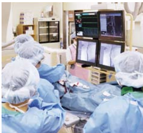
足の付け根からカテーテルを血管の中に誘導し、その管の中を様々な治療機器を通過させて、血管内から脳の病気を治療する「脳血管内治療」の様子。

「当院は急性期病院として、患者さんに対してすべての医師が同じレベルの治療が行えるよう、技術を維持・継承していかなければなりません。当科では救命から早期のリハビリまでを中心に行います。病状が落ち着いた後は、回復期病院にスムーズに引き継ぐため愛媛県のシームレスパスに参加し、病棟に支援ナースを配置するなど、その体制を整えています」