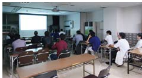
月1回行われる近隣病院の先生方との腎臓病勉強会

「透析を含めた腎臓病の治療は患者さんの日常生活そのものです。その中で特に食事療法がとても大切で、日頃は看護師から、また定期的に管理栄養士から専門的な食事管理の情報提供を行っています。更に入院が必要となった場合には、入院中の体力維持のため積極的にリハビリテーションを行い、治療後の日常生活への復帰を速やかに行う試みなど、多職種で患者さんを中心とした医療を行っています。今後はより高いレベルの医療を地域全体に提供出来るようにスタッフ一丸となって臨んでいきたいと思っています」