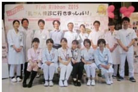
乳がんの早期発見や検診受診の大切さを訴えるピンクリボン2015「乳がん検診に行きまっしょい!」の様子

「当院では乳がん看護認定看護師が患者さんやご家族の身体的・心理的・社会的サポートなどを行っています。また、化学療法室専任薬剤師による診察前面談も始めています。多くのスタッフが患者さんと積極的に関わっています。チームをまとめていくにあたり私が頑張る姿を示すことで、スタッフが仕事に対して高い意識を持つようになってくれたと思います。この5年間で理想のチーム医療が構築できつつあると感じています。今後は他の院内スタッフ、さらには近隣のクリニックなどと連携し、その技術を地域に広げていくことで、より多くの患者さんに質の高い治療を受けていただけるものと信じています」