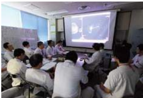
毎週早朝に行われる医師による外科カンファレンス

外科医同士の縦の関係、他部署との横の連携によって、より良いチーム医療が実現しているのです。