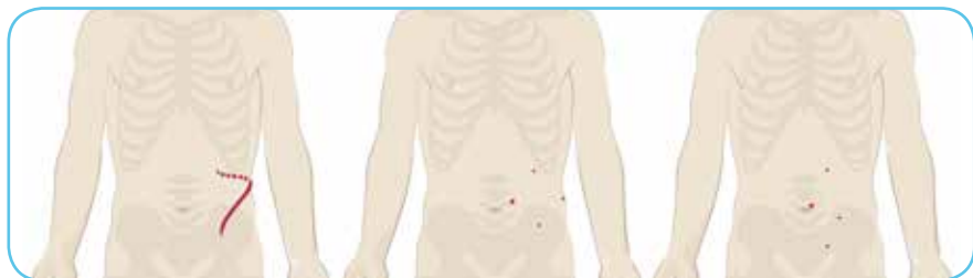
開腹手術における 切開部

ロボット支援手術は、腎部分切除術を必要としている患者様のためのもう1つの低侵襲性手術の選択肢です。術者は従来の腹腔鏡手術と同じように、いくつかの小さな切開部を作ります。3Dハイビジョンシステムや、人の手首よりはるかに大きく曲がって回転する手首を備えた器具を特長としています。